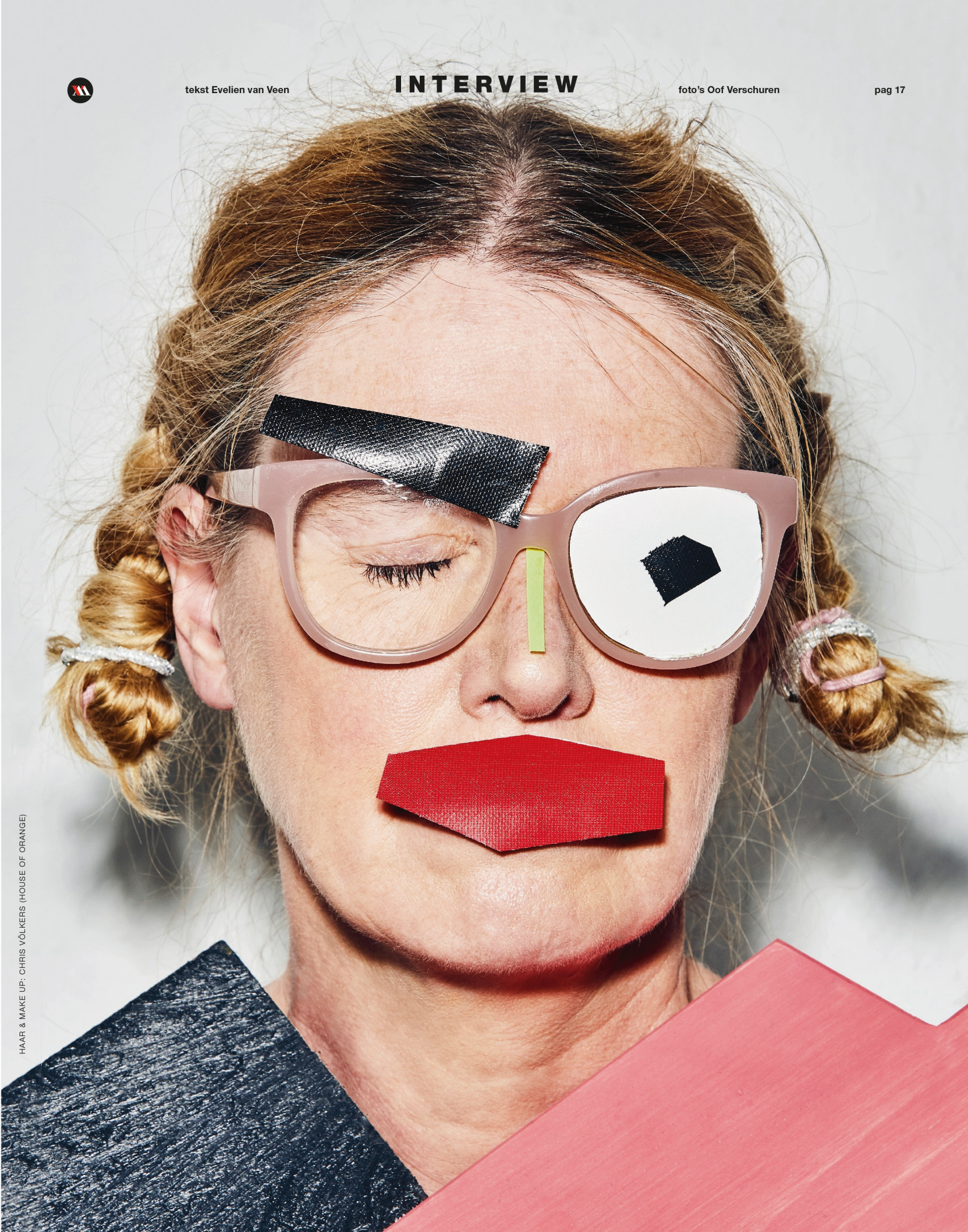
HAAR & MAKE UP: CHRIS VÖLKERS (HOUSE OF ORANGE)