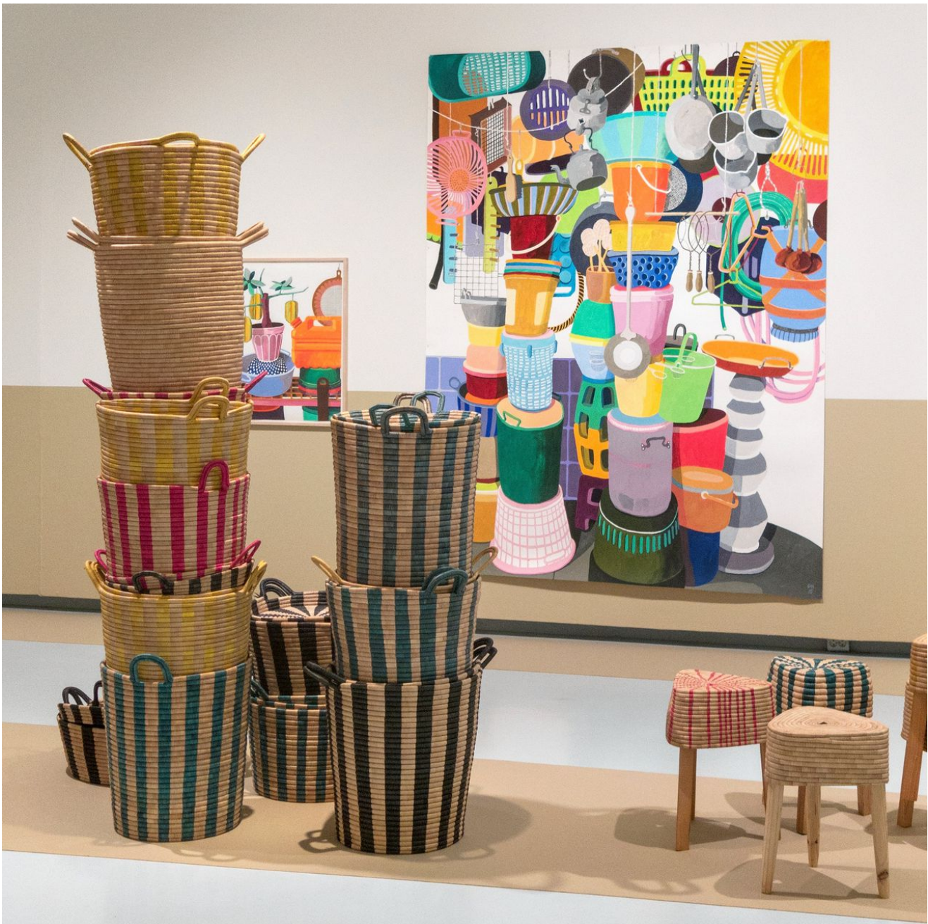
'Storage & Stools' (2017) van Ineke Hans en 'Kolkata Plastics' (2016) van Erik Mattijssen in Museum Het Valkhof Nijmegen.