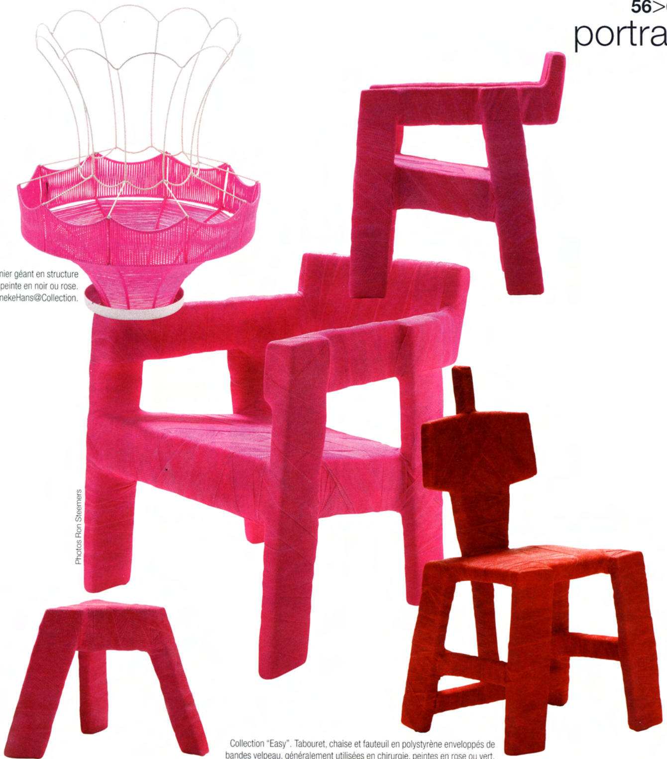
Collection "Easy". Tabouret, chaise et fauteuil en polystyrène enveloppés de bandes velpeau, généralement utilisées en chirurgie, peintes en rose ou vert. Distribué par InekeHans@Collection.