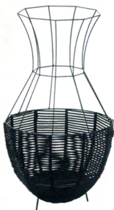
"Basket", panier géant en structure métallique peinte en noir ou rose. Distribué par InekeHans@Collection.