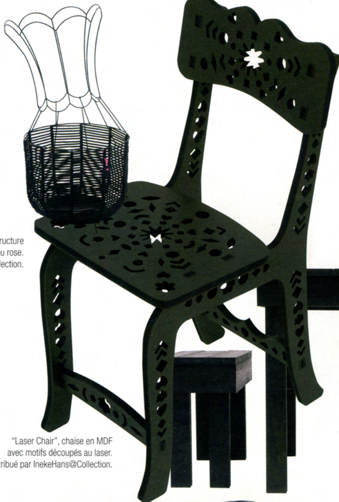
"Laser Chair", chaise en MDF avec motifs découpés au laser. Distribué par InekeHans@Collection.