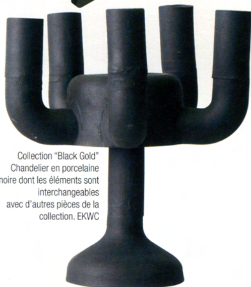
Collection "Black Gold" Chandelier en porcelaine noire dont les éléments sont interchangeables avec d'autres pièces de la collection. EKWC